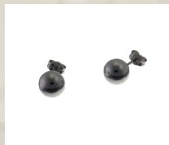
P346W Mitat: 7,0 mm