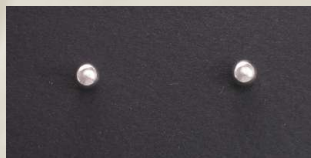
E390 Mitat: 5,0 mm