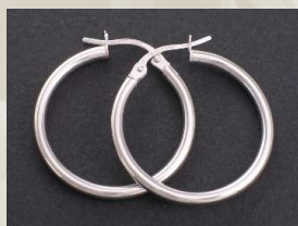
E387 Mitat: 20*24*2 mm