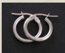
E371 Mitat: 10*14*2 mm